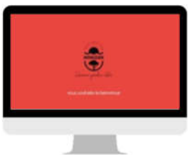
Écran d'accueil de l'Office